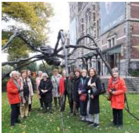
Guided tour at Rijksmuseum garden – Louise Bourgeois

Le LC d'Amsterdam est heureux d'informer toutes les Lycéennes des derniers événements de notre club, notamment, celles qui ont visité Amsterdam lors du Congrès de 2016.