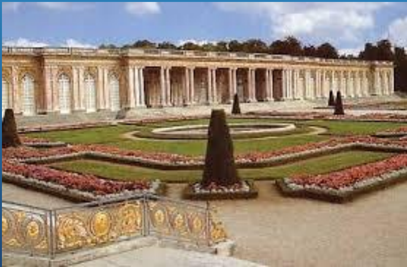
Le grand Trianon