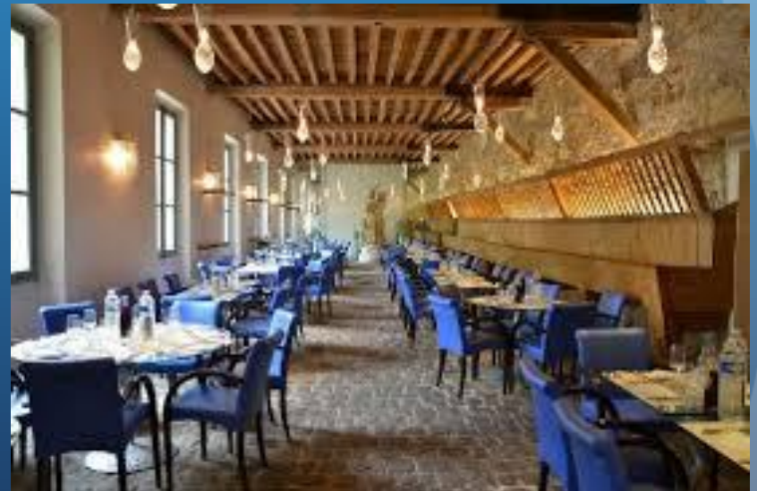
La petite Venise

12:00pm Lunch restaurants « La Flotille » and « La petite Venise » in the castle park