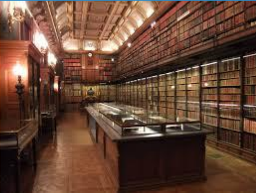
Bibliothèque et archives