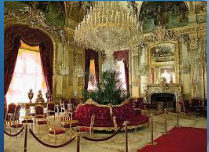
Le Louvre XVIII