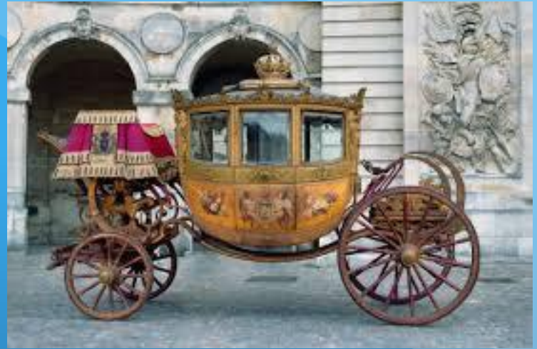
La galerie des Carrosses