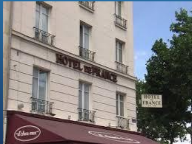
Hôtel de France