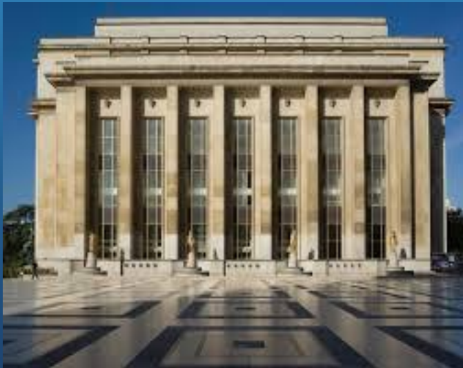
Musée de l'Homme