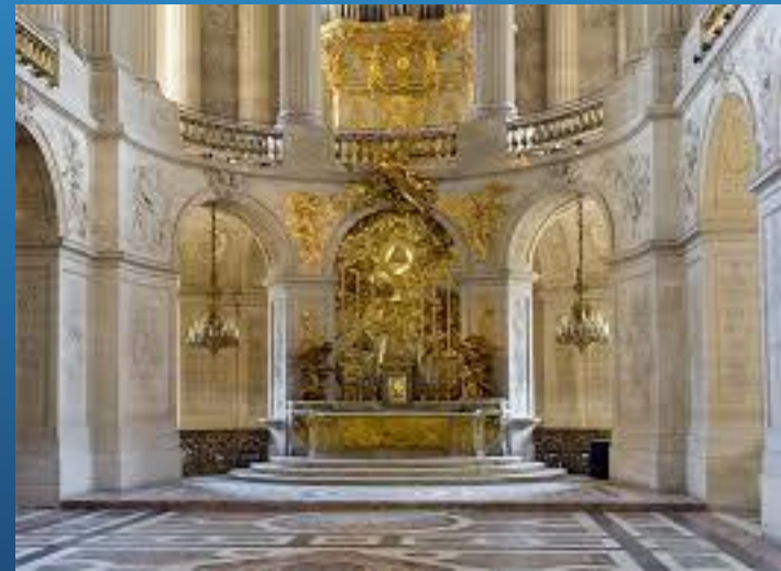
La Chapelle Royale