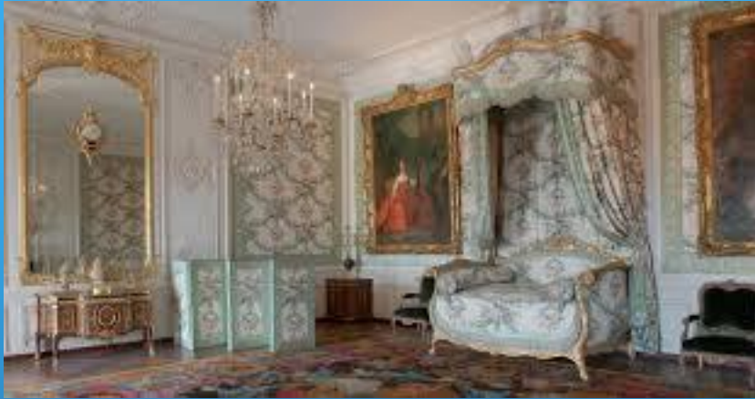
Les appartements de Mesdames