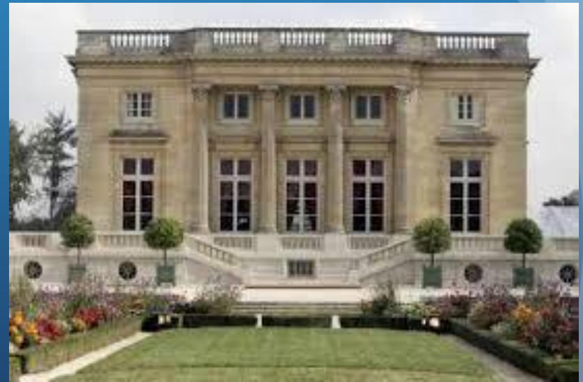
Le petit Trianon